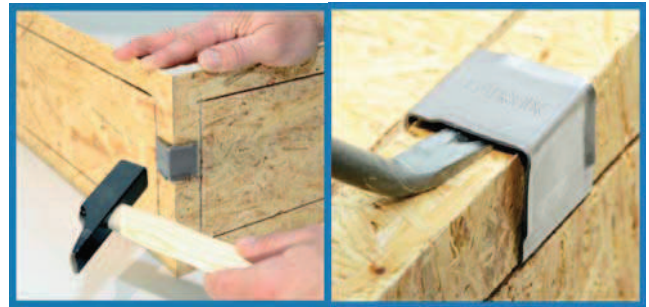
Zur Montage ist nur ein Hammer notwendig, zum Öffnen ein Schraubendreher.

Ein ideales Beispiel zur Prozessoptimierung ist aus mei-