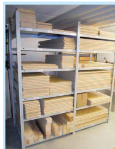
Die Huber Diffraktionstechnik GmbH aus dem Chiemgau arbeitet mit FastFix in Modulbauweise, da die Produkte des Unternehmens ständig andere Abmessungen haben. In einem Lagerregal stehen stapelweise derzeit 18 verschiedene Kistenteile zur Verfügung, woraus sich exakt 43 unterschiedliche Kistenmaße von 250 x 250 x 250 mm bis 1.200 x 950 x 950 mm zusammenbauen lassen. „Damit können wir endlich flexibel und zeitsparend verpacken und die Sendungen schneller an den Spediteur übergeben“, sagt der Versandleiter des Unternehmens.