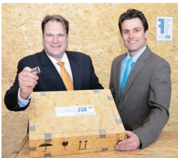
Unser System ist „made in Germany“.

Was meinen Sie genau mit „höherer Flexibilität bei wechselnden Maßen und Gewichten“?