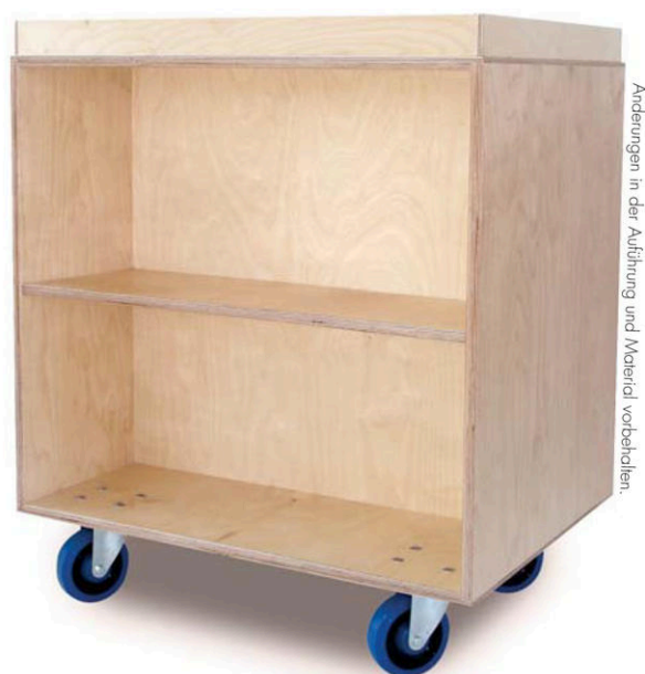
Änderungen in der Ausführung und Material vorbehalten.

Zur Absicherung aufliegender Standard-Umzugskartons