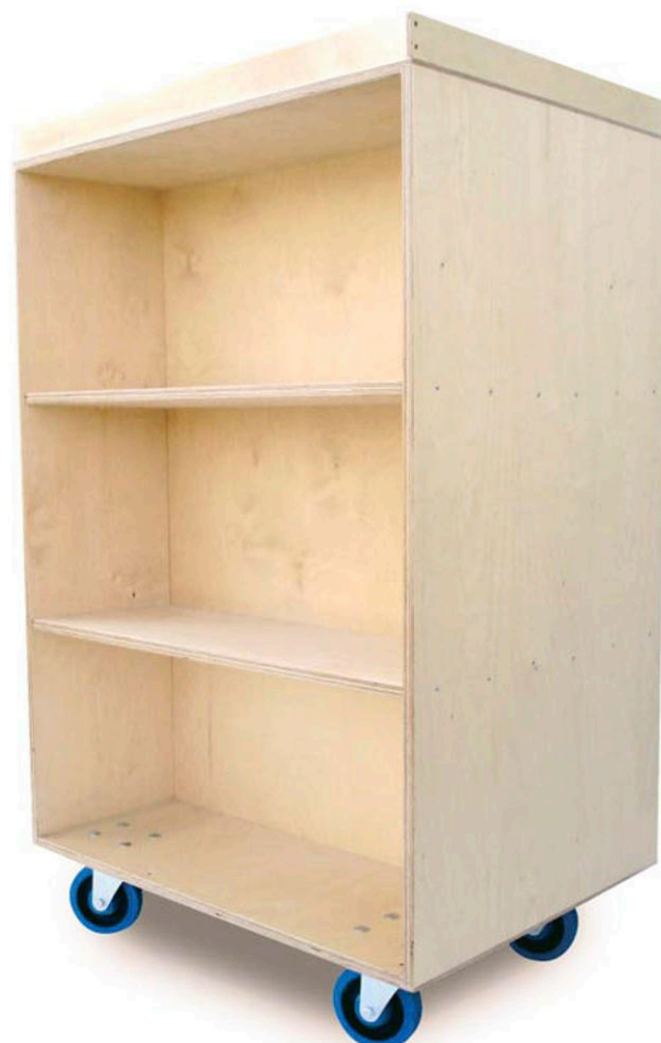
Änderungen in der Ausführung und Material vorbehalten.

Zur Absicherung aufliegender Standard-Umzugskartons