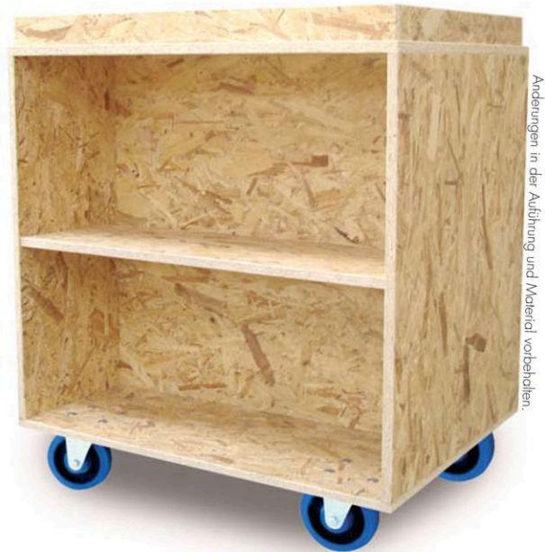
Änderungen in der Ausführung und Material vorbehalten.

Zur Absicherung aufliegender Standard-Umzugskartons